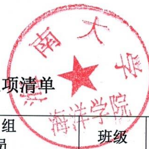
2020年海洋学院本科生创新课题立项清单